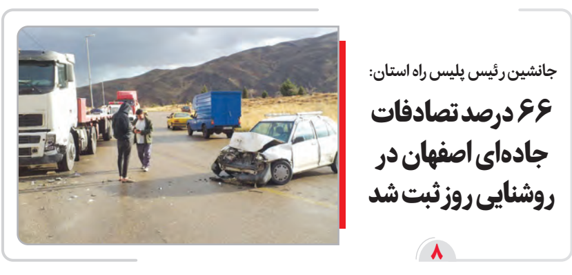
جانشین رئیس پلیس راه استان: ۶۶ درصد تصادفات جاده‌های اصفهان در روشنایی روز ثبت شد