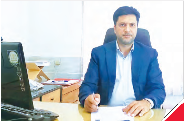
کرده و هشداری لازم را به ارگان‌های مسئول ارائه دهند.