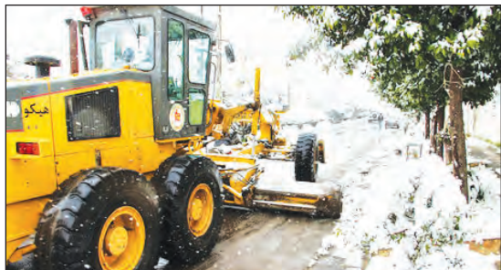
شهرستان کوهستانی و سردسیر سمیرم دارای ۴۰ کیلومتر بزرگراه، ۷۵ کیلومتر راه اصلی، ۱۲۵ کیلومتر راه فرعی و ۴۰۳ کیلومتر راه روستایی است.