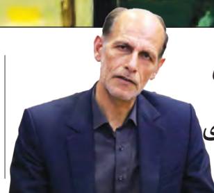
پیشگیری از آسیب‌های اجتماعی در مدارس نیازمند تقویت جنبه‌های دینی است