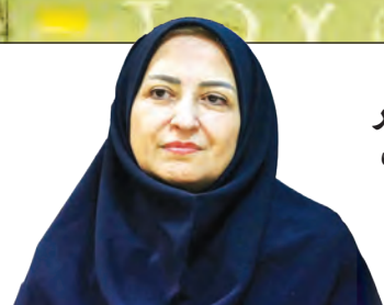
زاینده رود نمایانگر تمدن ایرانی است