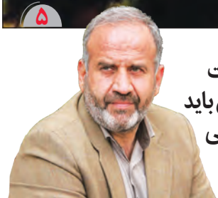
محدوده واقعی بافت تاریخی شهر اصفهان باید توسط میراث فرهنگی مشخص شود