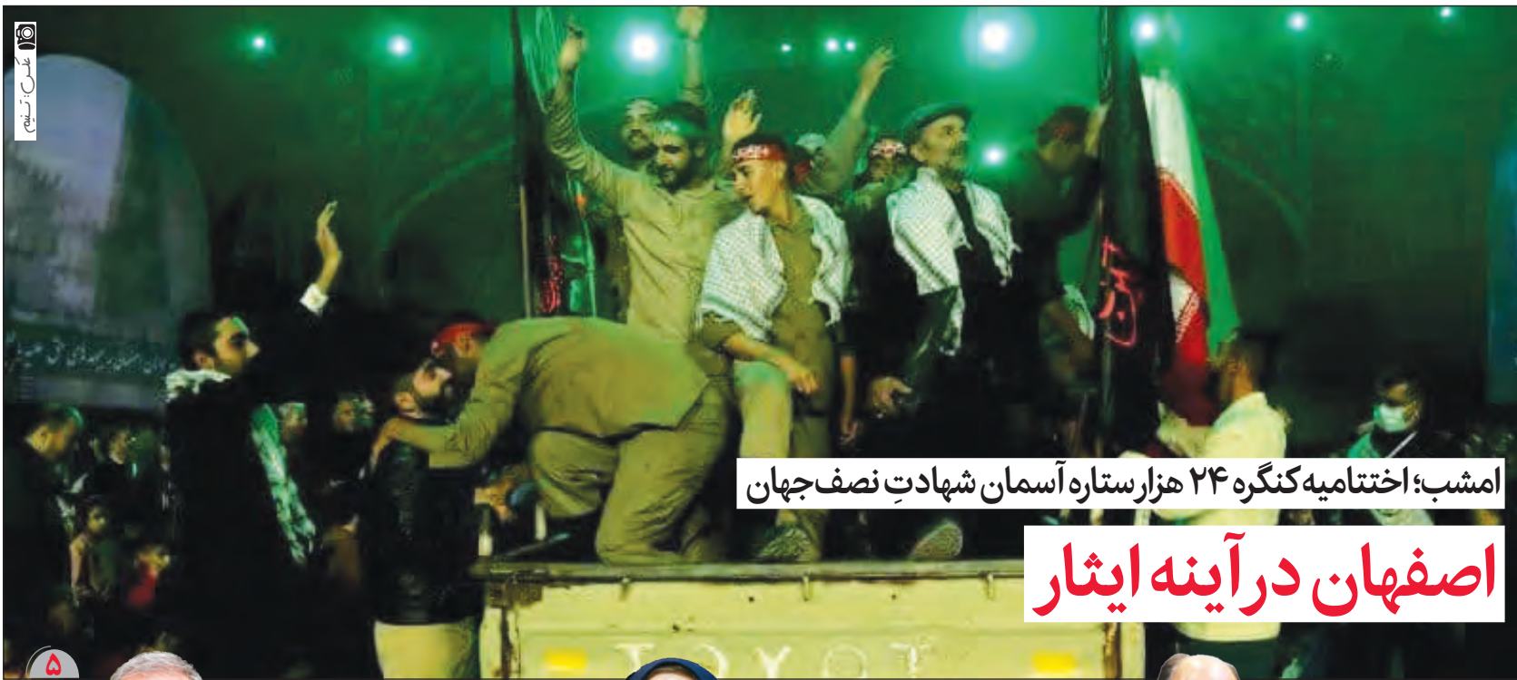
امشب؛ اختتامیه کنگره ۲۴ هزار ستاره آسمان شهادتِ نصف جهان