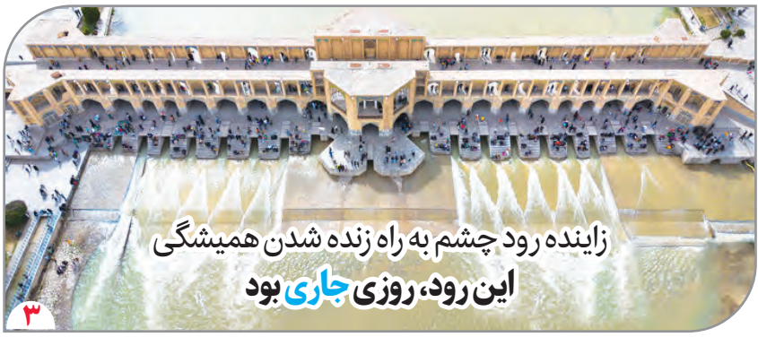
زاینده رود چشم به راه زنده شدن همیشگی این رود، روزی جاری بود