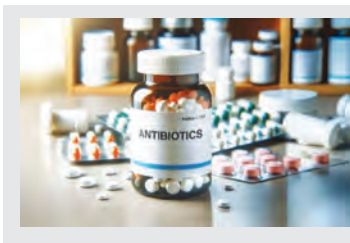
۳۳ درصد نسخه های پزشکی در اصفهان حاوی آنتی بیوتیک است حدود چهار میلیون و ۱۸۹ هزار نسخه حاوی آنتی بیوتیک در استان اصفهان سال گذشته در سامانه تأمین اجتماعی ثبت شد که ۳۳ درصد از کل نسخه ها را شامل می شود. ۵

در مراسم تجلیل از خیران نیکوکار ستاد دیه مطرح شد