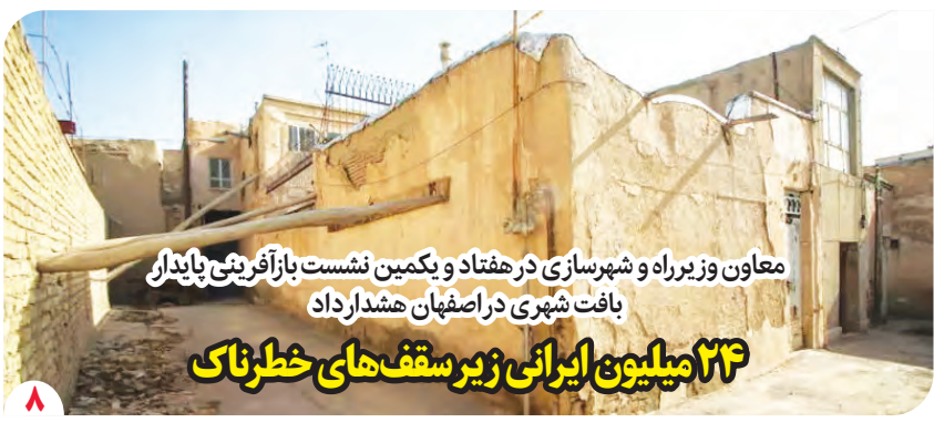
معاون وزیر راه و شهرسازی در هفتاد و یکمین نشست بازرگانی پایدار بافت شهری در اصفهان هشدار داد ۲۶ میلیون ایرانی زیر سقف های خطرناک