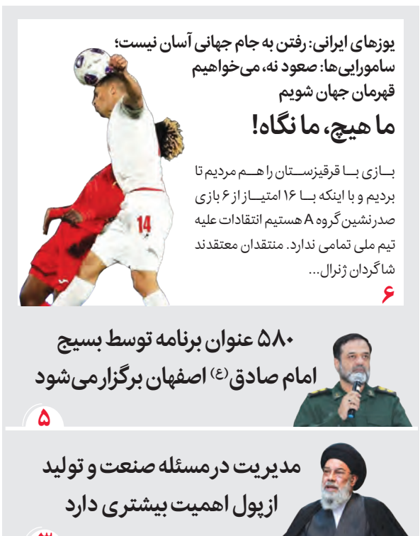
یوزهای ایرانی: رفتن به جام جهانی آسان نیست؛ سامواریها: صعود نه، می خواهیم قهرمان جهان شویم ما هیچ، ما نگاه! بازی با قرقیزستان را هم مردم تا بردیم و با اینکه ۱۶ امتیاز از ۶ بازی صدرنشین گروه A هستیم انتقادات علیه تیم ملی تمامی ندارد. منتقدان معتقدند شاگردان ژنرال... ۶