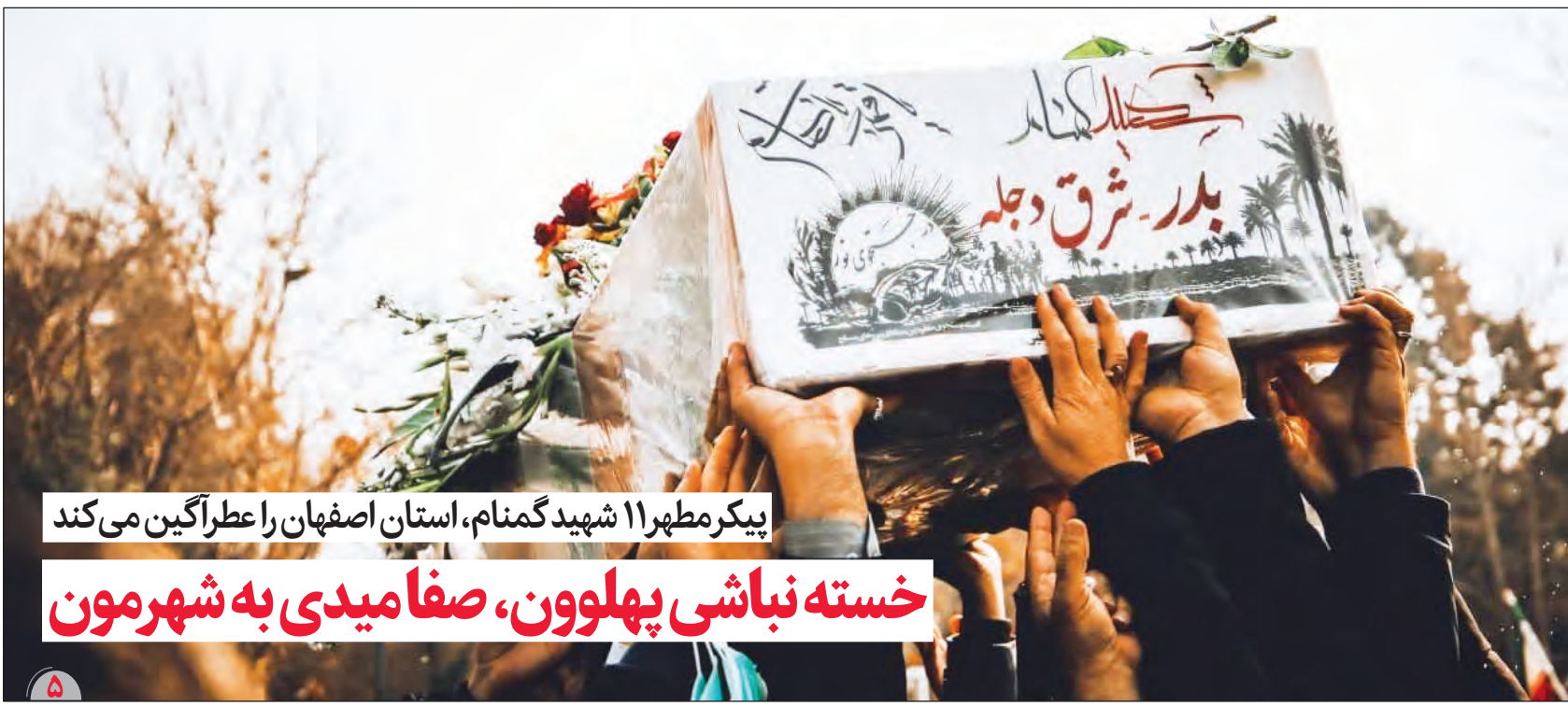
پیکر مطهر ۱۱ شهید گمنام، استان اصفهان را عطر آگین می کند خسته نباشی پهلوون، صفا میدی به شهرمون