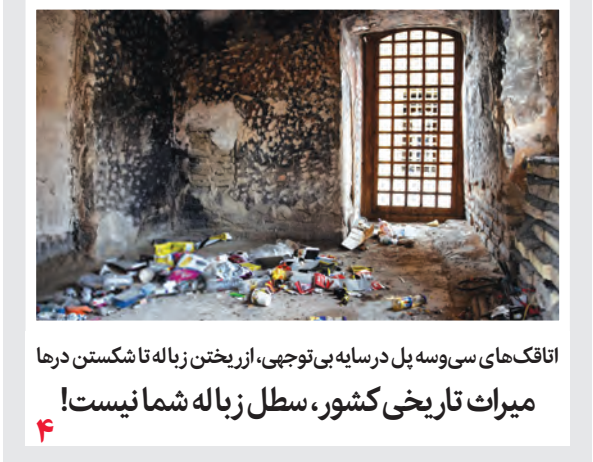
اتاقک های سی و سه پل در سایه بی توجهی، از ریختن زباله تا شکستن درها میراث تاریخی کشور، سطل زباله شما نیست! ۴