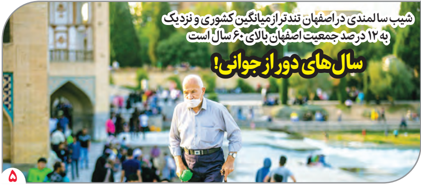
شیب سالمندی در اصفهان تندتر از میانگین کشوری و نزدیک به ۱۲ درصد جمعیت اصفهان بالای ۶۰ سال است