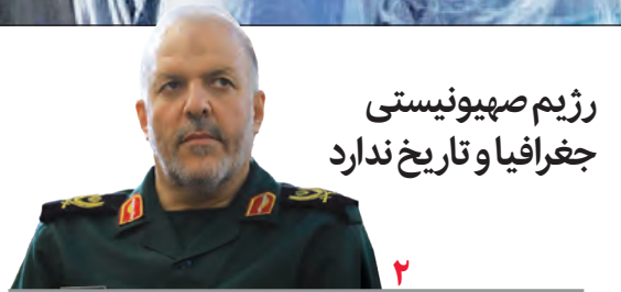
رژیم صهیونیستی جغرافیا و تاریخ ندارد