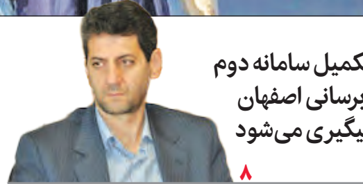
تکمیل سامانه دوم آبرسانی اصفهان پیگیری می‌شود