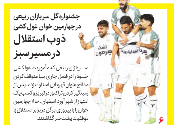
جشنواره گل سربازان ربیعی در چهارمین خوان گول کشتی ذوب استقلال در مسیر سبزی

سربازان ربیعی که مأموریت گولکشتی خود را در فصل جاری با موفقیت انجام دادند مدافع عنوان قهرمانی استارت زدند پس از زمینگیر کردن تراکتور در تریز و کسب یک امتیاز از شهر آورد اصفهان. حالا چهارمین خوان را با پیروزی پرگل در برابر استقلال با موفقیت پشت سر گذاشتند.