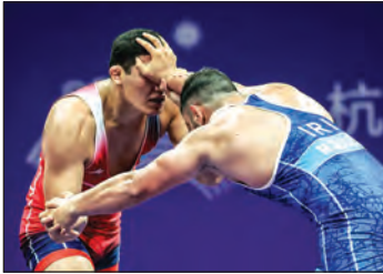
اهدا شده که پاداش طلایی‌ها ۶ میلیارد و ۲۰۰ میلیون تومان بود.

فدراسیون کشتی مبلغ پاداش‌های کسب مدال در رقابت‌های جهانی اوزان غیر المپیک را اعلام کرد. به گزارش «مهر»، مسابقات جهانی اوزان غیر المپیک از ۷ تا ۱۰ آبان ماه به میزبانی تیرانا پایتخت آلبانی برگزار خواهد شد. مبلغ پاداش اهدایی فدراسیون کشتی به مدال آوران مسابقات جهانی اوزان غیر المپیک بدین شرح است: «مدال طلا: یک میلیارد تومان و چه نقد به همراه ۳۰ میلیون تومان حقوق ماهیانه، مدال نقره: ۵۰۰ میلیون تومان وجه نقد به همراه