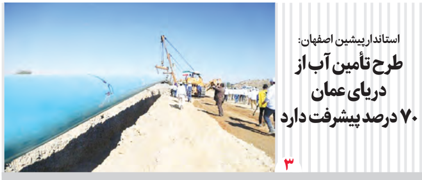
استاندار پیشین اصفهان: طرح تأمین آب از دریای عمان ۷۰ درصد پیشرفت دارد

■ اخیراً ۶۵ دستگاه ماینر قاچاق به ارزش ۴۰ میلیارد ریال در اصفهان کشف و ضبط شد؛ این کشف نشان دهنده حجم بالای فعالیت‌های غیرقانونی در حوزه استخراج ارز دیجیتال است؛ کارشناسان برآورد می‌کنند که هر دستگاه ماینر در طول یک سال می‌تواند بین ۰.۱ تا ۰.۲ بیت کوین استخراج کند؛ اگر این تعداد ماینر به‌طور قانونی فعالیت می‌کردند، درآمد قابل توجهی برای مالکان خود ایجاد می‌کردند. دولت باید به جای محدود کردن این فعالیت‌ها، چارچوب‌هایی برای مدیریت و نظارت بر تولید ارزهای دیجیتال ایجاد کند چرا که موضوع ناترازی برق و تأثیر آن بر قطعی برق صنایع و وضعیت اقتصادی کشور معضلی اساسی است که باید در بخش‌های مختلف برای پیشگیری از آن برنامه ریزی شود. ■