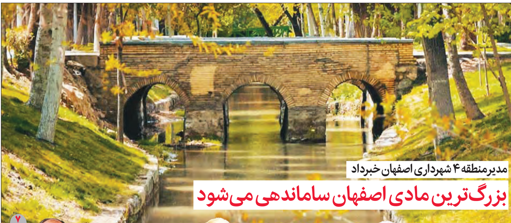
مدیر منطقه ۴ شهرداری اصفهان خبر داد