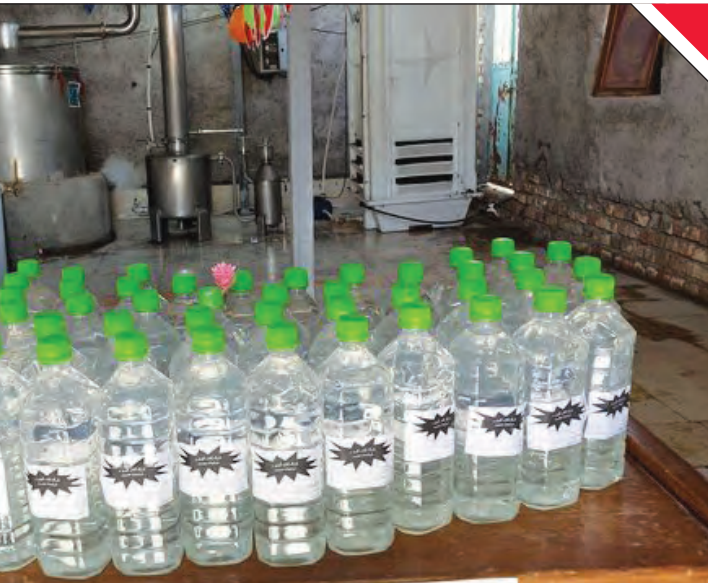
معاون غذا و داروی دانشگاه علوم پزشکی کاشان از شناسایی و ضبط ۴۰۰۰ لیتر گلاب و عرقیات گیاهی فاقد مجوز و غیرمجاز از یک منزل مسکونی در کاشان خبر داد.