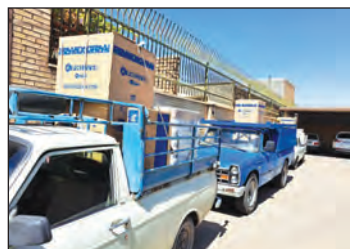
قراری می‌گیرد که در سال جاری تاکنون ۷۰ قلم توزیع شده است.