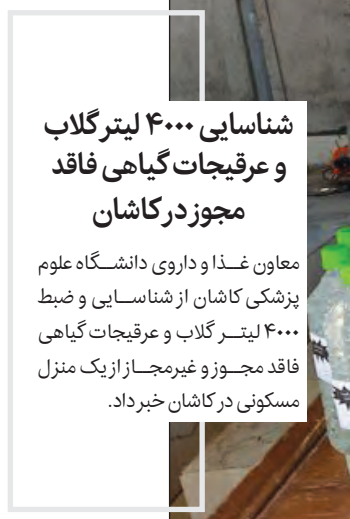
شناسایی ۴۰۰۰ لیتر گلاب و عرقیات گیاهی فاقد مجوز در کاشان

معاون غذا و داروی دانشگاه علوم پزشکی کاشان از شناسایی و ضبط ۴۰۰۰ لیتر گلاب و عرقیات گیاهی فاقد مجوز و غیرمجاز از یک منزل مسکونی در کاشان خبر داد.