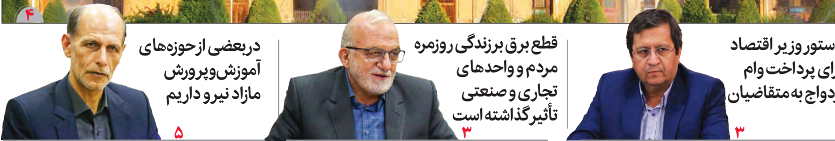
در بعضی از حوزه‌های آموزش و پرورش مازاد نیرو داریم