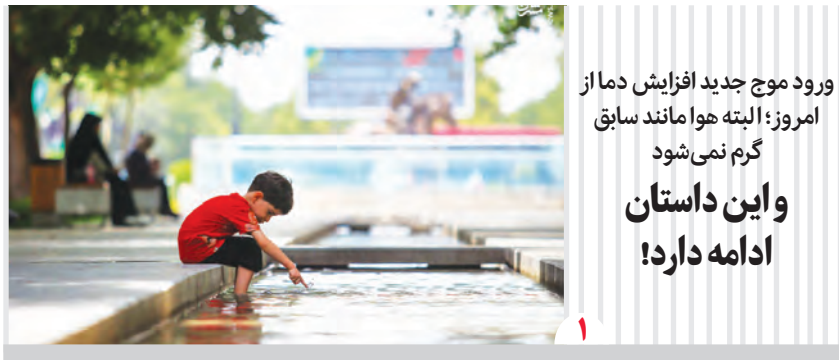
ورود موج جدید افزایش دما از امروز؛ البته هوا مانند سابق گرم نمی‌شود و این داستان ادامه دارد!