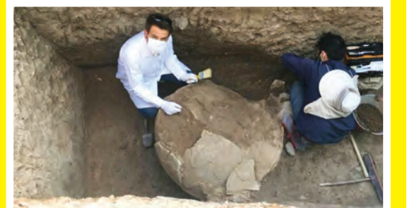
پژوهشگران درگیر کشف یافته‌های باستانی «کمزورین» اصفهان هستند

جابه‌جایی ۸۰ هزار زائر در مرز مهران توسط اتوبوسرانی اصفهان