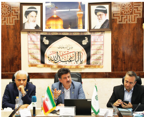
■ وصول ۲۰۷ میلیارد تومانی از محل فرار مالیاتی

■ جایگاه اداره کل امور مالیاتی اصفهان در سطح اقتصادی استان با وصول مالیات و تأمین بودجه به میزان ۹۸ درصد بودجه سال تعیین شده است.