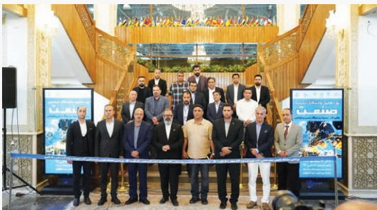
نوزدهمین نمایشگاه تخصصی صنعت ماشین‌آلات، تجهیزات و ابزارآلات صنعتی و کارگاهی تا امروز شنبه از ساعت ۱۶ الی ۲۲ در محل دائمی نمایشگاه‌های بین‌المللی استان اصفهان واقع در کمربندی شرقی، مقابل منطقه روشن دشت برای بازدید علاقه‌مندان و عموم دایر خواهد بود.