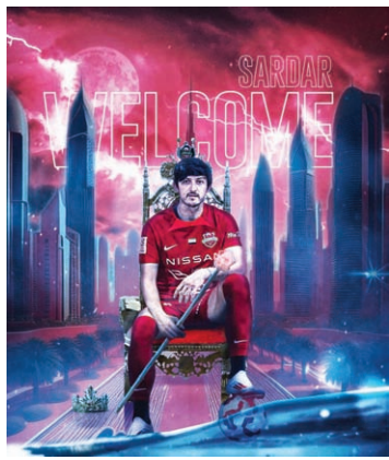
سردار آزمون روی سریر مرضیه غفاریان

روسیه، تجربه بازی در یونسلینگا آلمان و حضور در سری A ایتالیا به خاورمیانه بازگرد. سردار ایرانی که با پیوستن به لیگ برتر روسیه در ۱۷ سالگی عنوان جوان ترین لژیونر ایرانی را از آن خود کرده در حالی در مرداد ۱۴۰۳ و در ۲۹ سالگی به آسیا بازگشته تا برای اولین بار با پوشیدن پیراهن تیمی از این قاره به میدان رود، که زوج بوشهری او در تیم ملی ۶ سال پیش، یعنی در مرداد ماه ۱۳۹۸ در سن ۲۷ سالگی با پوشیدن پیراهن تیم ریوه آوه پرتغال برای نخستین بار بازی در تیم های اروپایی را تجربه کرد. شاید آن زمان با توجه به سن و سال طارمی کمتر کسی فکری کرد ستاره جنوبی تیم ملی در طی کردن راه موفقیت از ستاره شمالی این تیم پیشی بگیرد. اما همیشه پیش بینی ها درست از آب در نمی آید. طارمی با عملکرد درخشان خود در ریوه آوه مدیران پورتو را متقاعد کرد تا این بازیکن ایرانی را برای تقویت خط حمله تیم خود به خدمت