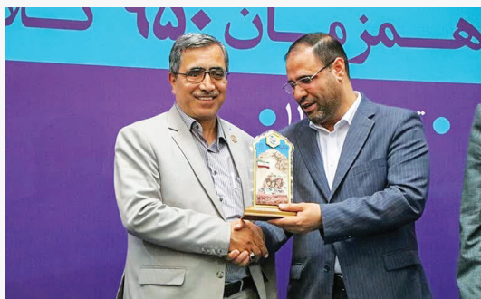
در بیست و ششمین رویداد ملی تکریم خیرین مدرسه ساز کشور توسط وزیر آموزش و پرورش از مدیرکل نوسازی مدارس استان به جهت کسب

رتبه برتر در برگزاری جشنواره خیرین مدرسه ساز استان ها تجلیل شد. به گزارش روابط عمومی اداره کل نوسازی مدارس استان اصفهان، بیست و ششمین همایش ملی خیرین مدرسه ساز کشور با حضور محمد مخبر سرپرست ریاست جمهوری، اسماعیلی رئیس دفتر ریاست جمهوری، رضامراد صحرایی وزیر آموزش و پرورش، سید مرتضی بختیاری رئیس کمیته امداد، حمیدرضا خان محمدی رئیس سازمان نوسازی مدارس کشور و جمعی دیگر از مسئولان ارشد کشوری با تقدیر از ۷۰۰ خیر مدرسه ساز از سراسر کشور در سالن اجلاس سران کشورهای اسلامی برگزار شد. گفتنی است بیست و ششمین جشنواره خیرین مدرسه ساز استان اصفهان خردادماه امسال و با حضور وزیر آموزش و پرورش، معاون عمرانی وزیر و رئیس سازمان نوسازی مدارس کشور، استاندار اصفهان و جمعی از خیرین مدرسه ساز و مسئولین برگزار شد.