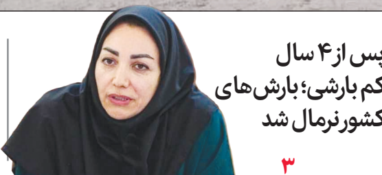
پس از ۴ سال کم بارشی؛ بارش های کشور نرمال شد