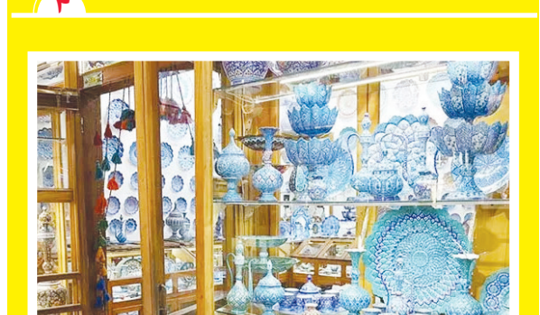
صنایع دستی، شایسته غزل نصف جهان است رو درو دیوار این شهر، همش از تو یادگاره!

اصفهان در بازاریابی و تبلیغات گردشگری حائز رتبه برتر کشور شد