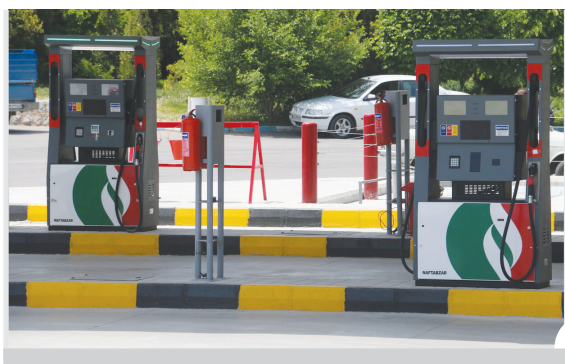
اعلام آمادگی شهرداری برای احداث جایگاه سوخت در مناطق ۱۲ و ۱۳ اصفهان

هفته گذشته که یک نقل قول پرسر و صدا به صدر اخبار استان آمد. مدیرکل حفاظت محیط زیست استان اصفهان به پالایشگاه رفت و در جمع حاضرین عنوان کرد که پالایشگاه اصفهان و فولاد مبارکه در آینده نزدیک از فهرست صنایع آلاینده خارج می شوند و افرادی که به دنبال منابع عوارض آلاینده هستند باید به فکر منابع دیگری باشند. این درحالی است که واکنش ها به اظهار نظر تازه مدیرکل محیط زیست استان در این خصوص ادامه دارد و مطابق انتظار، بیشترین واکنش را هم اعضای شورای شهر داشته اند.