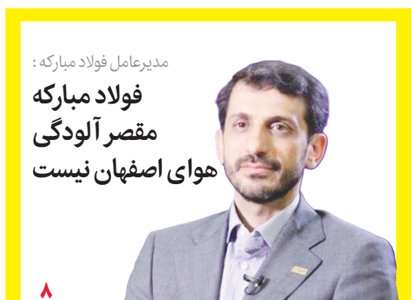
مدیرعامل فولاد مبارکه: فولاد مبارکه مقصر آلودگی هوای اصفهان نیست

تکمیل زنجیره ارزش با تعامل ۲ استان اصفهان و سیستان و بلوچستان