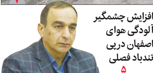
افزایش چشمگیر آلودگی هوای اصفهان در پی تندباد فصلی