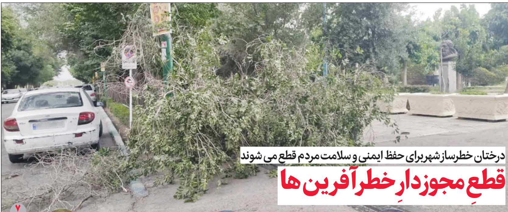
درختان خطرناک شهر برای حفظ ایمنی و سلامت مردم قطع می شوند قطع مجوزدار خطر آفرین ها