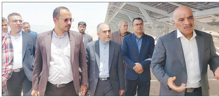
نمایندگی از استان اصفهان همزمان با پروژه‌های کشور مورد بهره‌برداری قرار گرفت.

افزایش کرد: توسعه نیروگاه‌های تجدیدپذیر استان اصفهان به ویژه در شهرستان نایین به جهت ظرفیت بالا، تابش خورشید و شرایط مستعد زمینی این شهرستان با سرعت بیشتری نسبت به گذشته در دستور کار است. به گزارش «ایمنا»، نیروگاه خورشیدی یک مگاواتی شامل بیش از ۲۰۰۰ پنل خورشیدی با ظرفیت ۱۰۰۰ کیلووات و اعتباری بالغ بر ۲۷ میلیارد تومان توسط بخش خصوصی احداث روز دوشنبه با حضور مدیرعامل شرکت توزیع برق استان اصفهان، فرماندار ویژه شهرستان نایین، مدیر امور برق شهرستان و دیگر مسئولان به بهره‌برداری رسید. روز دوشنبه ۲۸ خرداد، ۱۳ نیروگاه