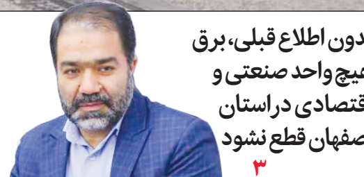
بدون اطلاع قبلی، برق هیچ واحد صنعتی و اقتصادی در استان اصفهان قطع نشود