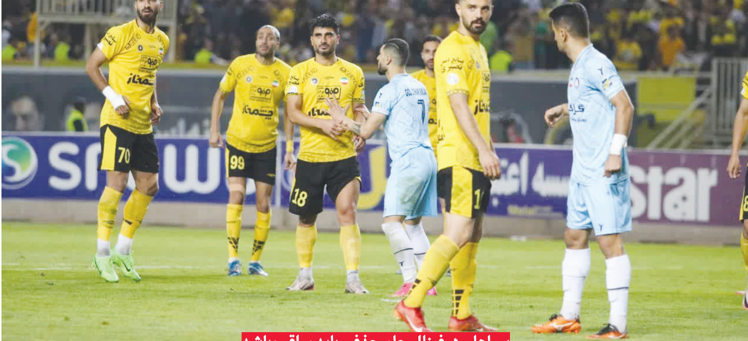
سپاهان در فینال جام حذفی باید مراقب باشد