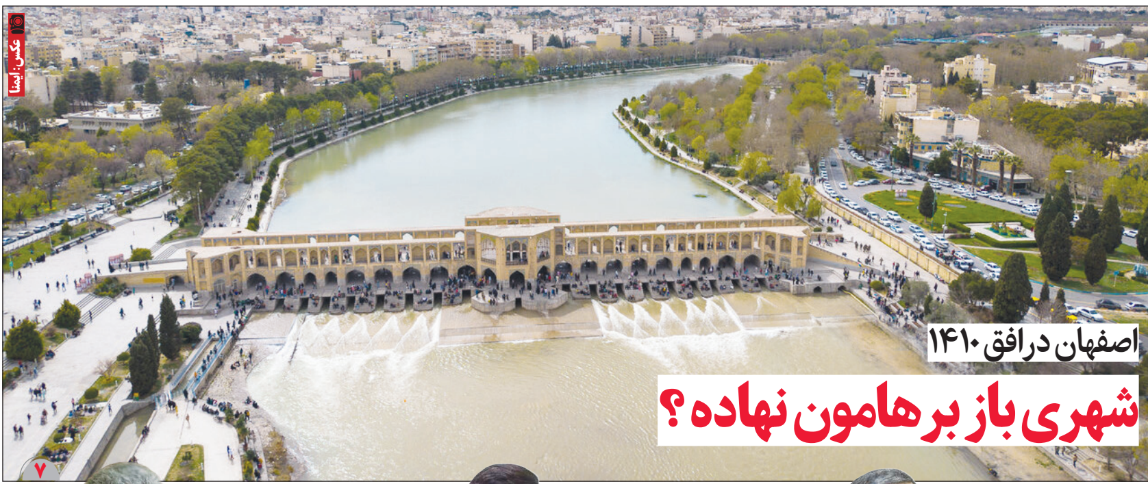
اصفهان در افاق ۱۴۱۰