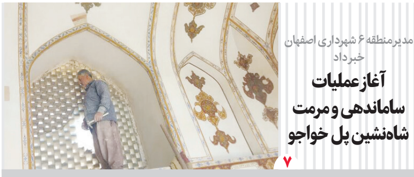
مدیر منطقه ۶ شهرداری اصفهان خبر داد آغاز عملیات ساماندهی و مرمت شاهنشین پل خواجه