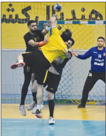
بود، در ثانیه‌های پایانی توانست ششمین برد خود را کسب کند تا این فصل را در جایگاه نهمی به پایان برساند.

هفته پایانی لیگ برتر هندبال مردان در حالی با کسب عنوان سوم تیم گیتی‌پسند به پایان رسید که دیگر تیم همشهری آنها، سپاهان و قهرمان فصل قبل لیگ از کسب سکوی بازماند. به گزارش «مهر»، هفته بیست و دوم و پایانی سی و ششمین دوره رقابت‌های لیگ برتر هندبال مردان با شکست گرامی داشت «شهدای خدمت» شنبه پنجم خردادماه با برگزاری ۵ دیدار به پایان رسید که طی آن در مهم‌ترین دیدار در نصف جهان، گیتی‌پسند توانست علاوه بر تحمیل نخستین شکست فصل به صنعت مس کرمان، جایگاه سومی فصل را از آن خود کند. در اولین بازی این هفته بازیکنان تیم گیتی‌پسند که تنها به یک پیروزی برای ایستادن روی سکوی نیاز