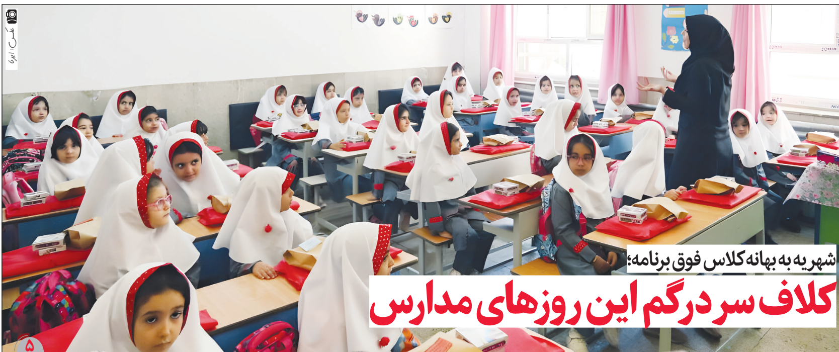
شهریه به بهانه کلاس فوق برنامه؛