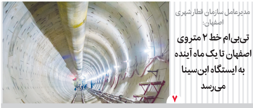
مدیرعامل سازمان قطار شهری اصفهان: تی بی ام خط ۲ متروی اصفهان تا یک ماه آینده به ایستگاه ابن سینا می‌رسد