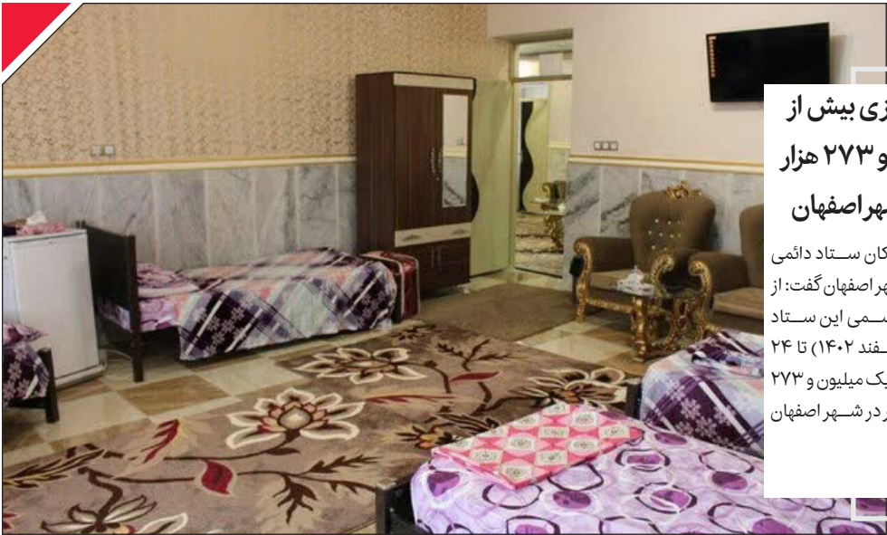
اسکان نروزی بیش از یک میلیون و ۲۷۳ هزار مسافر در شهر اصفهان

مسئول کمیته اسکان ستاد دائمی خدمات سفر شهر اصفهان گفت: از ابتدای فعالیت رسمی این ستاد (بیست و چهارم اسفند ۱۴۰۲) تا ۲۴ فروردین امسال، یک میلیون و ۲۷۳ هزار و ۴۲۱ مسافر در شهر اصفهان اسکان یافته اند.