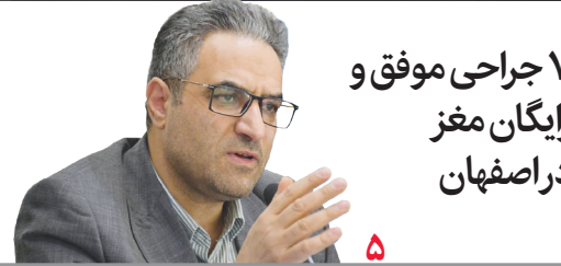
۷ جراحی موفق و رایگان مغز در اصفهان