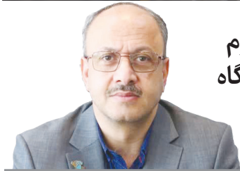
اصفهان رتبه دوم برگزاری نمایشگاه در کشور