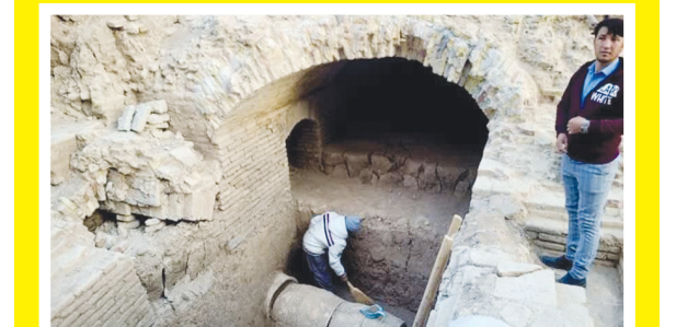
پایان موقت کاوش در محوطه تازه کشف شده در اصفهان روایت کشف شگفت انگیزها

تزییق ۲۹۰۰ میلیارد تومان اوراق مشارکت برای حمل و نقل اصفهان