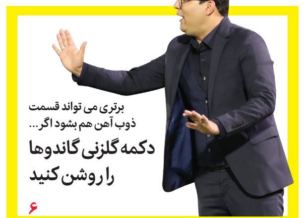
برتری می تواند قسمت ذوب آهن هم بشود اگر... دکمه گلزنی گاندوها را روشن کنید

۳۸۰۰ نفر به بدنه آموزش و پرورش ابتدایی استان اصفهان وارد می شوند