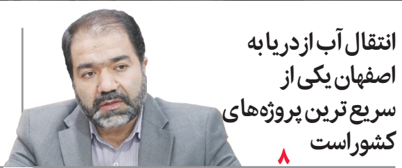
انتقال آب از دریا به اصفهان یکی از سرریزترین پروژه های کشور است