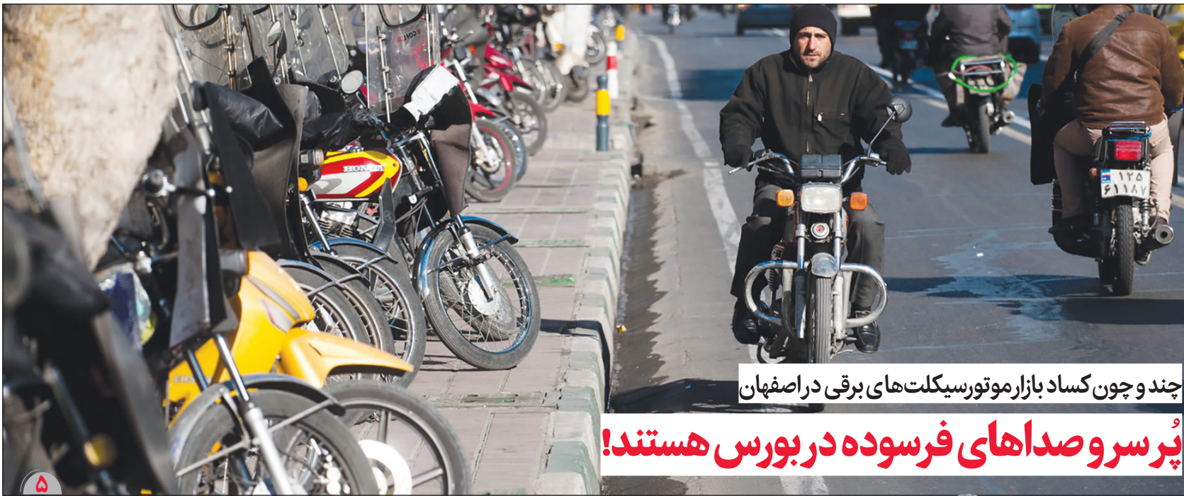
چند و چون کساد بازار موتورسیکلت های برقی در اصفهان