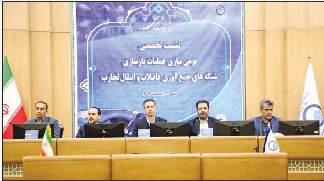
■ آبرسانی به هسته مرکزی شهر اصفهان