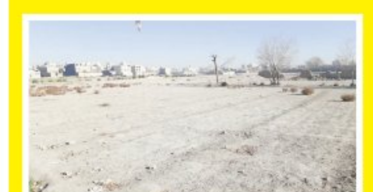
تعیین تکلیف اراضی صحرای پرتمان پس از دو دهه بلاتکلیفی

صادرات گیاهان دارویی اصفهان به ۱۱ میلیون دلار رسید