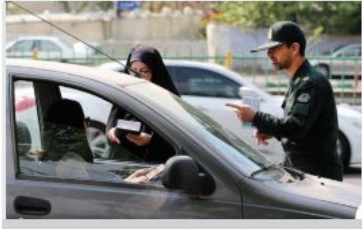
اطلاعیه فرماندهی انتظامی استان اصفهان درباره حجاب و عفاف