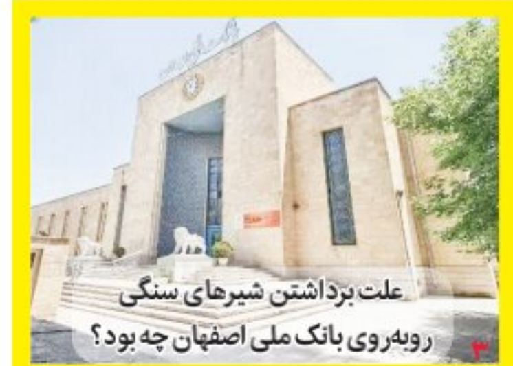
علت برداشتن شیرهای سنگی روبه روی بانک ملی اصفهان چه بود؟

افتتاح پایگاه انتقال خون گلپایگان در روز عید فطر