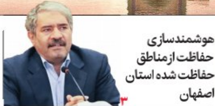
هوشمندسازی حفاظت از مناطق حفاظت شده استان اصفهان