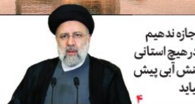
اجازه ندهیم در هیچ استانی تنش آبی پیش بیاید