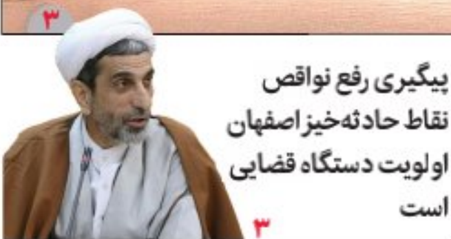
پیگیری رفع نواقص نقاط حادثه خیز اصفهان اولویت دستگاه قضایی است