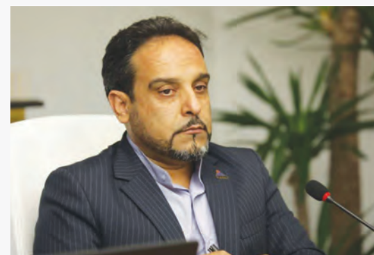
افراد سودجو و فرصت طلب که با این گونه اقدامات قصد ضربه زدن به افراد محدود و محدود کردن جایگاه نظام مقدس جمهوری اسلامی در آذهان عمومی هستند، باشند و هیچ گاه مدارک و هویت خود را برای اشخاص بدون هویت رسمی و معتبر ارسال نکنند.