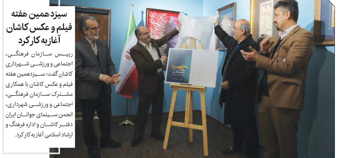
سیزدهمین هفته فیلم و عکس کاشان آغاز به کار کرد

رییس سازمان فرهنگی، اجتماعی و ورزشی شهرداری کاشان گفت: سیزدهمین هفته فیلم و عکس کاشان با همکاری مشترک سازمان فرهنگی، اجتماعی و ورزشی شهرداری، انجمن سینمای جوانان ایران دفتر کاشان و اداره فرهنگ و ارشاد اسلامی آغاز به کار کرد.