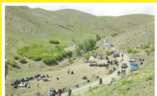
سنت‌هایی که در این روستای کاشان زنده و پویا مانده است؛ روستای آذران، روستای افسانه‌های اسفندی