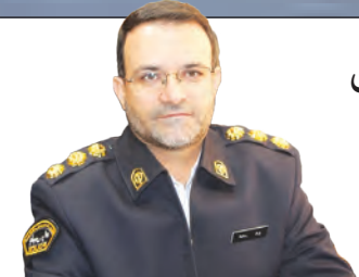
خودروهای رانندگان جنون سرعت در اصفهان، یک ماه توقیف می‌شود