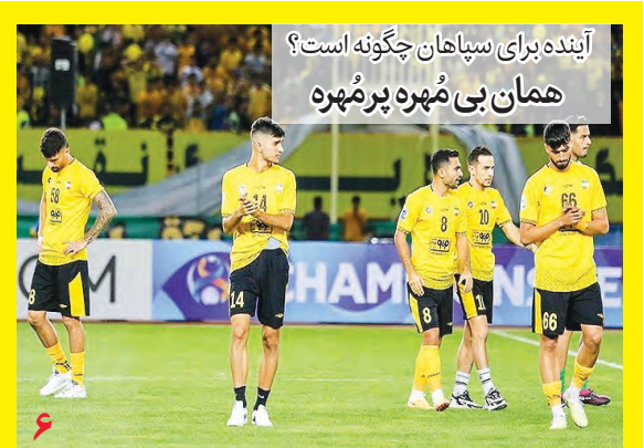
آینده برای سپاهان چگونه است؟ همان بی مهره پرمهره