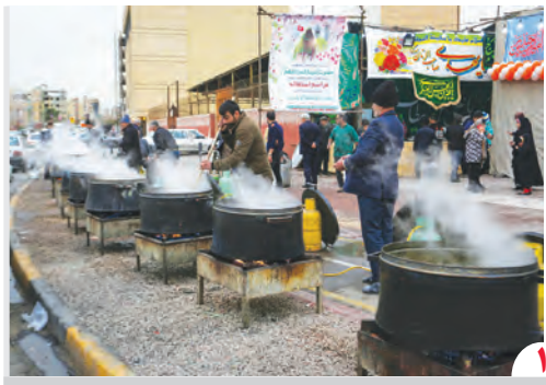
نصف جهان در سرور میلاد مهدی موعود (عج)