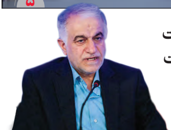
استفاده از مشارکت شهروندان، اولویت مدیریت شهری اصفهان است