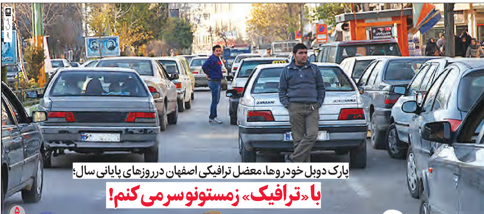
پارک دوبل خودروها، معضل ترافیکی اصفهان در روزهای پایانی سال؛ با «ترافیک» زمستونو سر می‌کنم!