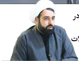
حضور حداکثری در انتخابات موجب گره‌گشایی مشکلات خواهد شد