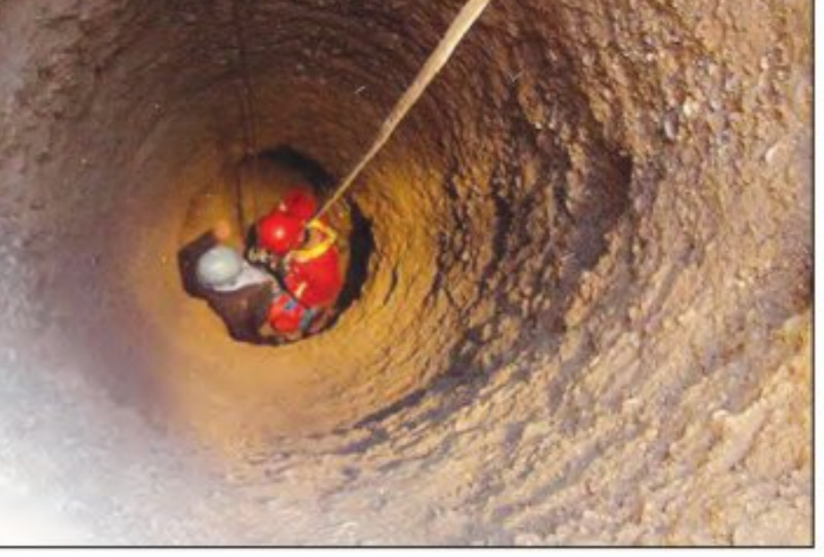
سقوط در چاه، دو جوان آران و بیدگل را به گام مرگ کشاند. در این حادثه دو جوان ۲۱ و ۲۷ ساله پس از عملیات رها سازی معاینه شدند، اما هر دو در اثر شدت جراحات در همان لحظات اولیه فوت کرده بودند.