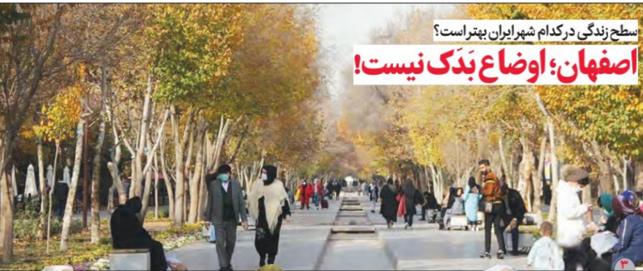
سطح زندگی در کدام شهر ایران بهتر است؟