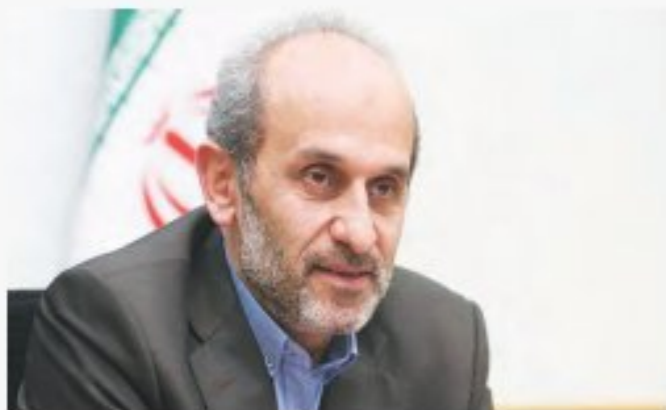
رئیس سازمان صداوسیما گفت: درب صدا و سیما روی همه سلبریتی ها باز است. پیمان جبلی در حاشیه سفر به کاشان برای حضور در هفتمین جشنواره تلویزیونی مستند که در تالار شهر شهرداری کاشان برگزار شد در گفت و گو با خبرنگار مهر اظهار داشت: صداوسیما از تمام ظرفیت های موجود برای ایجاد شور و نشاط اجتماعی استفاده می کند. وی با اشاره به اینکه درب های سازمان صداوسیما روی همه سلبریتی ها باز است، ابراز داشت: البته این نکته را هم باید در نظر داشت که سلبریتی ها در راستای منافع مردم و کشور باشند. رئیس سازمان صداوسیما تاکید کرد: سلبریتی ها باید در غم و شادی همراه مردم باشند و حتما می توان از ظرفیت آنها در رویدادهای اجتماعی هم استفاده کرد. چرا که هم افزایی چهره ها می تواند اتفاقات خوبی را برای مردم و کشور و رسانه صداوسیما رقم بزند. وی در بخش دیگری از سخنانش خود انتقاد برخی نسبت به بخش موسیقی مبتذل در صداوسیما را بحق ندانست و تصریح کرد: همه دستگاه های متولی فرهنگی باید در این حوزه وظایف خود را انجام دهند. جبلی با بیان اینکه در سازمان صداوسیما سعی می کنیم که از تولیدات فاخر در حوزه موسیقی استفاده