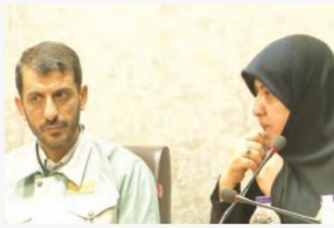
تامین نیاز صنایع فولادی از زمینه ساز رشد تولید در کشور برشمرده و افزود: با برنامه ریزی های دقیق در این شرکت فولادی چالش های انرژی مدیریت و نیاز صنایع پایین دستی به طور کامل تامین شده است.

در مواجهه با کمبود سوخت نباید تحویل گاز به صنایعی که پیشران اقتصاد در کشور هستند، محدود شود. نماینده مردم مبارکه در مجلس در حاشیه بازدید از شرکت فولاد مبارکه با اشاره به تولید ورق های فولادی خاص و خودکفایی کشور در زمینه واردات این محصولات فولادی گفت: در کشور با ایجاد انرژی انرژی قطع انرژی، صنایع در دستور کار قرار می گیرد این در حالی است که صنایع بزرگ موتور و پیشران توسعه، زیر ساخت های اقتصادی در کشور هستند.