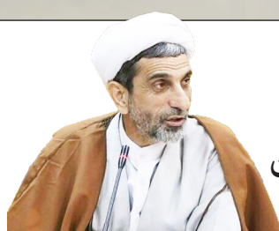
احیای ۲۰ واحد تولیدی در آستانه تعطیلی در اصفهان