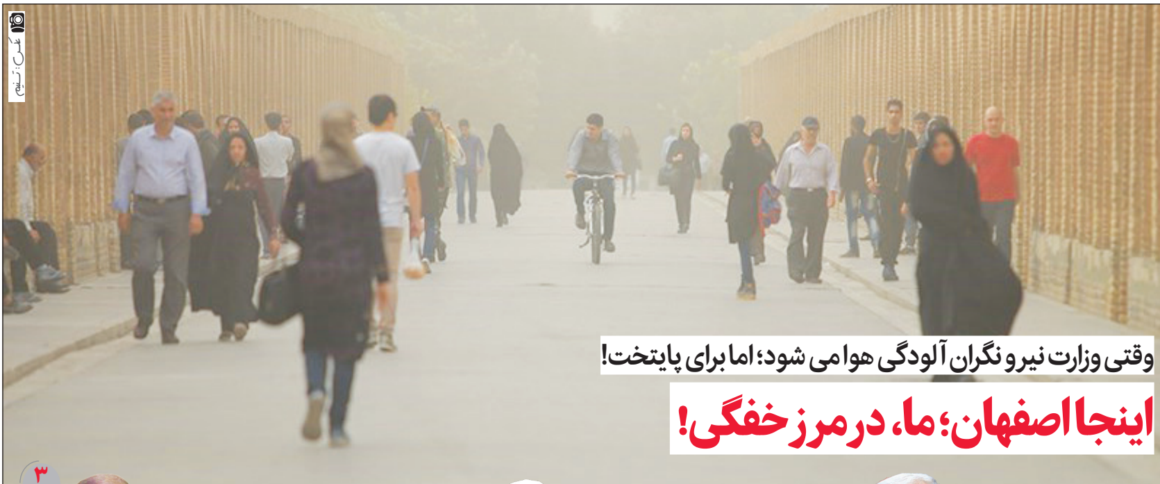
وقتی وزارت نیرو نگران آلودگی هوای شود؛ اما برای پایتخت! اینجا اصفهان؛ ما، در مرز خفگی!