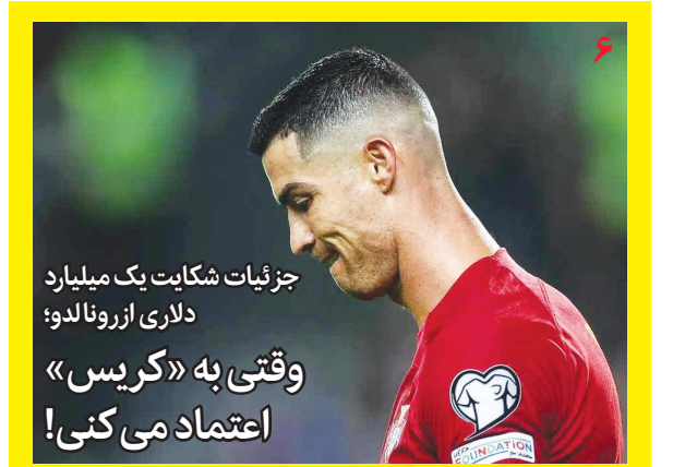
جزئیات شکایت یک میلیارد دلاری از رونالدو؛ وقتی به «کریسی» اعتماد می کنی!

تصویب برخی قوانین به آب های زیرزمینی کشور لطمه زده است