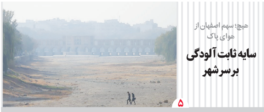
هیچ سهم اصفهان از هوای پاک سایه ثابت آلودگی بر سر شهر

مدیرکل مدیریت بحران استانداری اصفهان مطرح کرد: احیای زاینده رود و تالاب؛ در انتظار نگاهی ملی