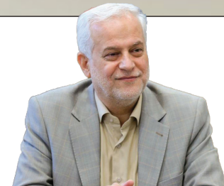
هزینه ۳ هزار میلیارد تومانی احداث هر کیلومتر قطار شهری