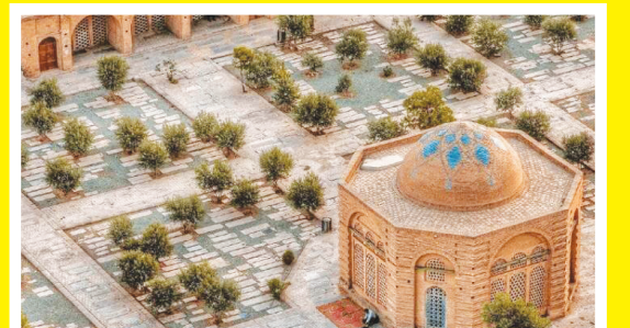
شناسایی و حذف نقاط بی دفاع شهری در تخت فولاد

همکاری ژاپنی ها برای مقابله با اثرات خشکسالی در جرقویه اصفهان