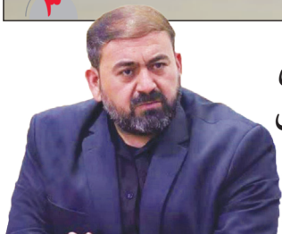
مسئولان کشوری حق مردم اصفهان در حوزه حمل و نقل را ادا کنند