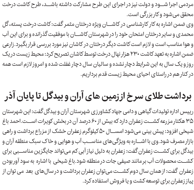
کارکنان جهاد کشاورزی شهرستان آران و بیدگل در حال برداشت زعفران در مزارع شهرستان آران و بیدگل.

مستول کمیته امداد حضرت امام خمینی (ره) بخش مرکزی گفت: گروه جهادی حیدر کرار متشکل از ۱۴ دندانپزشک و دستیار به مدت ۲ روز خدمات رایگان به ۲۰۰ نفر از افراد تحت پوشش کمیته امداد و نیازمندان ارائه کردند.