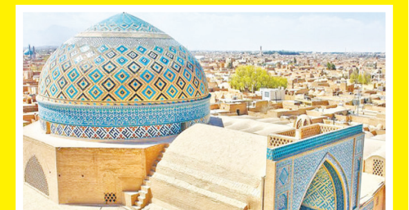
پژوهشگر شهر: بافت تاریخی، راوی قصه های شهر است