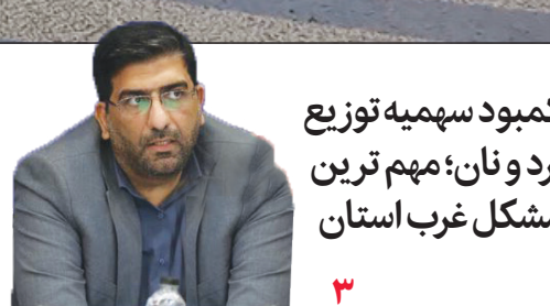
کمبود سهمیه توزیع آرد و نان؛ مهم ترین مشکل غرب استان