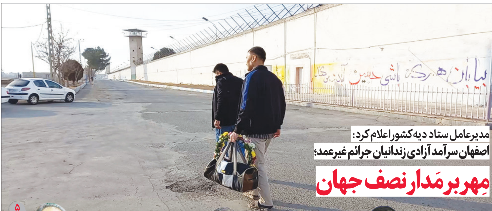
مدیرعامل ستاد دیه کشور اعلام کرد: اصفهان سرآمد آزادی زندانیان جرائم غیر عمد؛ مهر بر مدار نصف جهان