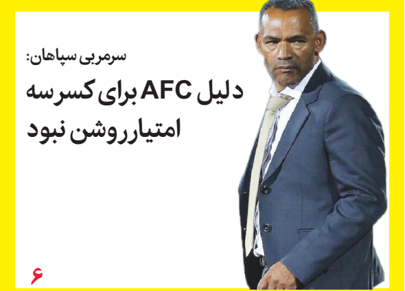
سرمدی سپاهان: دلیل AFC برای کسر سه امتیاز روشن نبود