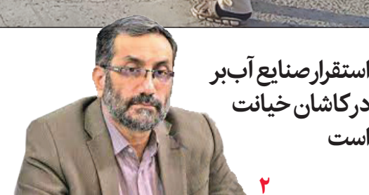
استقرار صنایع آب بر درکاشان خیانت است