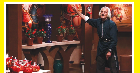
کاشان؛ میزبان جشنواره نقالی و روایتگری سیلک ۴