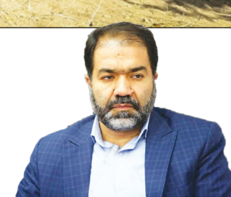
نسبت مصارف به منابع بانک های اصفهان ۲۲ درصد افزایش یافت ۳