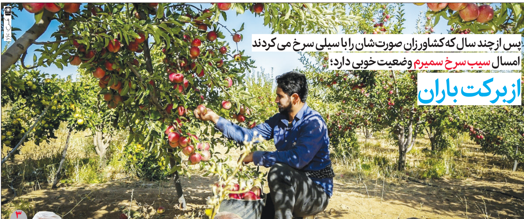
پس از چند سال که کشاورزان صورت شان را با سیلی سرخ می کردند امسال سیب سرخ سمیرم وضعیت خوبی دارد؛ از برکت باران