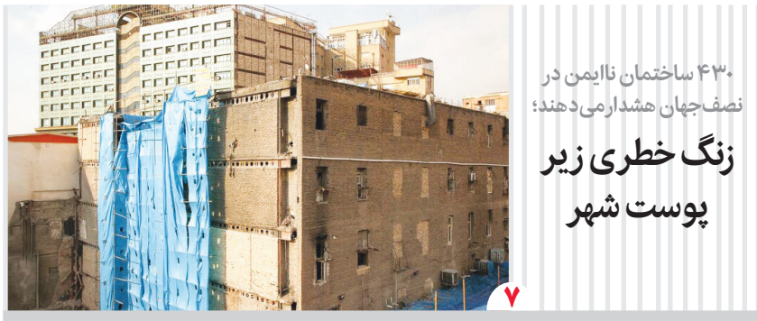
۴۳۰ ساختمان ناآمن در نصف جهان هشدار می دهند؛ زنگ خطری زیر پوست شهر