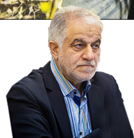
شورای شهر اصفهان از کمک به شوراهای حل اختلاف استقبال می کند ۷