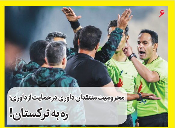
محرومیت منتقدان داوری در حمایت از داوری؛ ره به ترکستان!