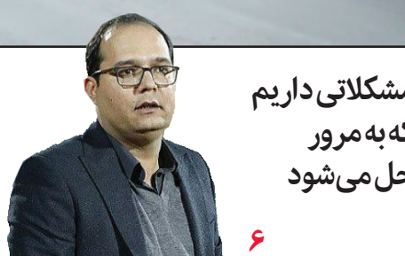
اجرای بیش از ۶۰ عنوان برنامه انتظامی در استان اصفهان