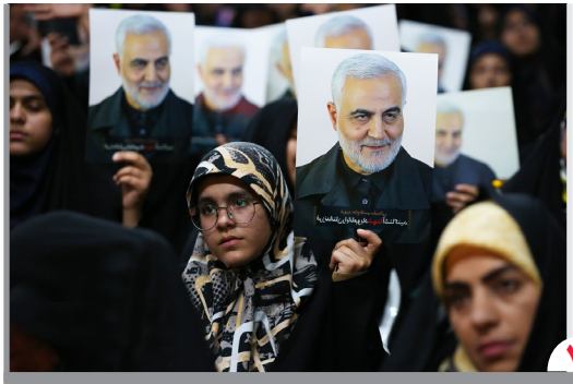
ادای احترام بانوان اصفحانی به سردار شهید حاج قاسم سلیمانی