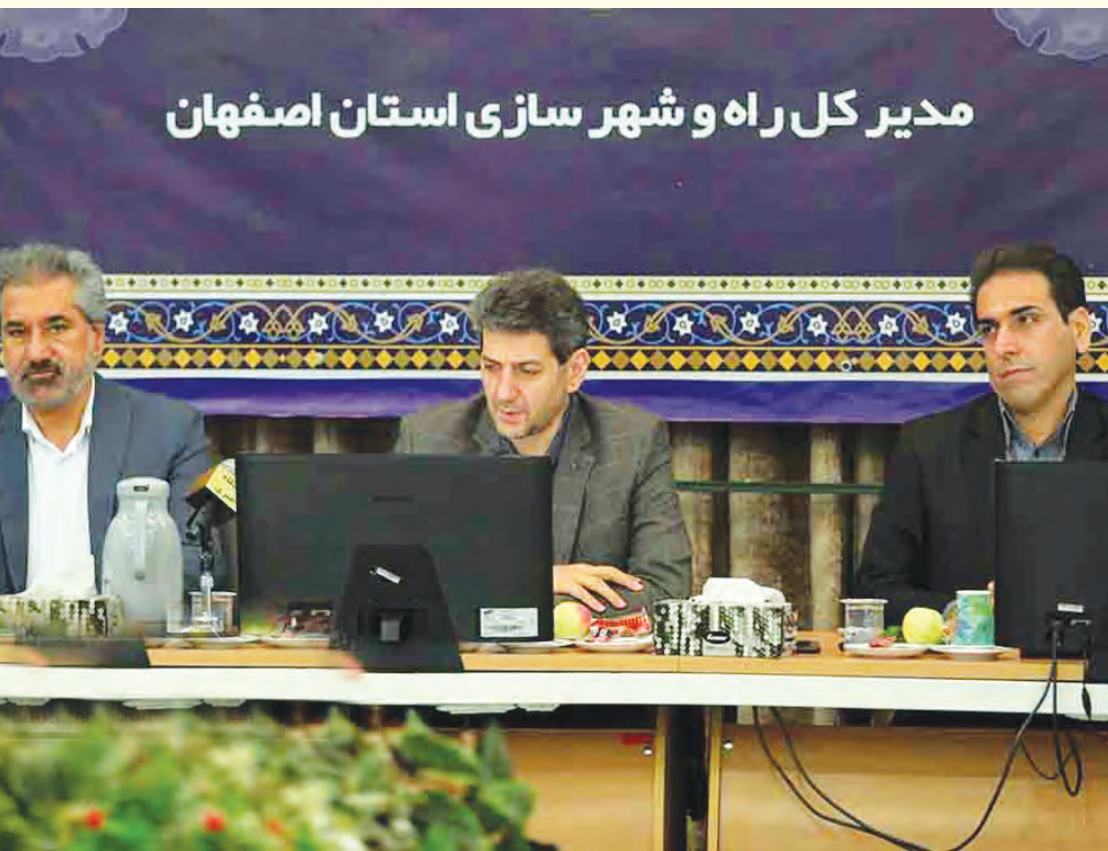
مدیر کل راه و شهر سازی استان اصفهان

در ادامه مشروح صحبت های علیرضا قاری قرآن در این نشست خبری